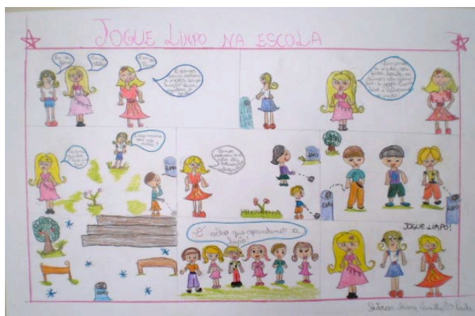
Fig. 1 - História final produzida por um grupo de alunas.

Nessa história, podemos observar o título centralizado, criativo, jogando com o sentido das palavras e indicando a compreensão da proposta, além de ter como base uma linha tracejada, que contorna toda a página do quadrinho. Podemos observar agora, o desenvolvimento da HQ, que se dá por meio da disposição dos quadros 21 ao longo da página, visto que a maioria possui formatos diferentes, fechando uma gestalt, integrando as partes no todo e que estão bem organizados ao longo da narrativa gráfica.